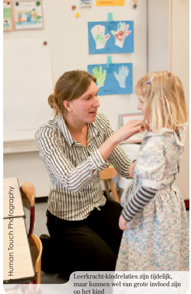
Leerkracht-kindrelaties zijn tijdelijk, maar kunnen wel van grote invloed zijn op het kind

Wanneer zulke grote variatie wordt vastgesteld in het type gehechtheid, rijst de vraag naar het waarom. Hoe komt het dat sommige kinderen er niet in slagen zich veilig te hechten aan hun opvoeders? Recent gedragsgenetisch onderzoek wijst uit dat erfelijke kindfactoren hierin slechts een kleine rol spelen (Out & Bakermans-Kranenburg, 2008). Wel kunnen bepaalde (combinaties van) stoornissen bij het kind (zoals autisme in combinatie met mentale retardatie) het risico op onveilige gehechtheid aan ouders verhogen. Maar onder 'normale' kinderen blijkt vooral de opvoedingsomgeving verantwoordelijk. Zo bevestigen studies dat een tekort aan sensitiviteit van ouders voor de signalen en behoeften van hun kind het risico op onveilige gehechtheid verhoogt. Het is dus belangrijk dat ouders door de ogen van hun kind (leren) kijken, diens signalen opmerken, juist interpreteren en er adequaat op inspelen. Interventies die specifiek met dit doel zijn ontwikkeld (bijvoorbeeld Video Interactie Feedback; Van IJzendoorn, 2008), blijken in staat om – in relatief korte tijd – de kwaliteit van de ouder-kindgehechtheid te verbeteren. Ook de wijze waarop ouders hun eigen gehechtheidverleden hebben verwerkt, de kwaliteit van hun partnerrelatie, ouderlijke stress of een depressie, blijkt het type gehechtheid dat