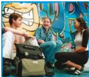
Van Horen Zeggen deel 1