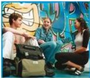
Van Horen Zeggen deel 1