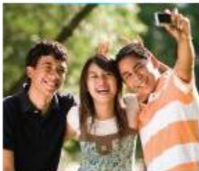
Van Horen Zeggen deel 2