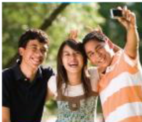
Van Horen Zeggen deel 2