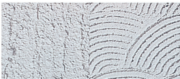
Figuur 5.6 Boerenpleister Pleister waarbij door middel van handveger of blokkwast een regelmatige waaivormige structuur wordt verkregen.