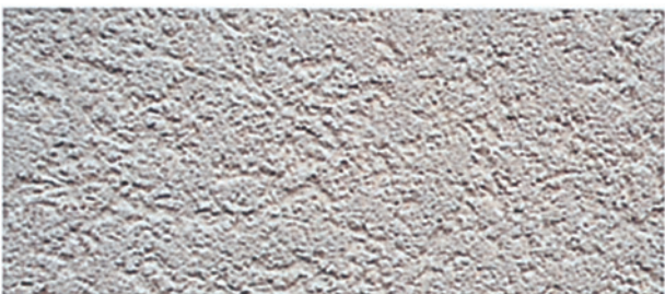
Figuur 5.3 Barokpleister Pleister met een lichte, korrelige structuur, korrel 2 - 4 mm