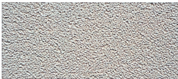
Figuur 5.1 Spachtelpleister Pleister met een rustig en regelmatig oppervlak, korrel 1,5 - 2 - 3 mm