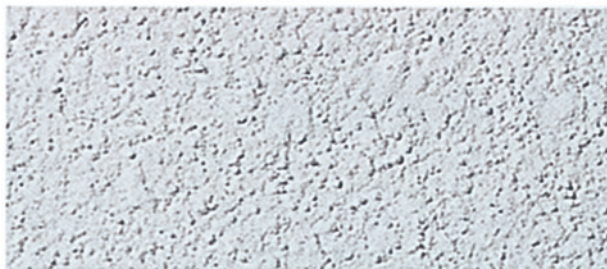
Figuur 5.4 Gespoten structuurpleister