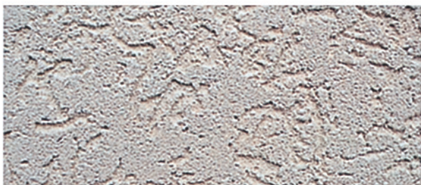
Figuur 5.2 Structuurpleister Pleister met schorseffect, korrel 2 - 3 - 4 - 5 mm