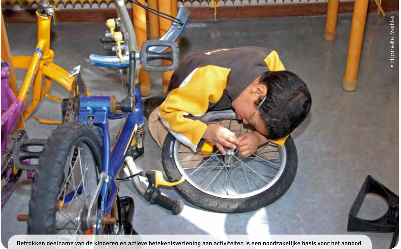
Betrokken deelname van de kinderen en actieve betekenisverlening aan activiteiten is een noodzakelijke basis voor het aanbod