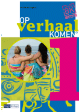
deel 1 vmbo-bk / lwoo