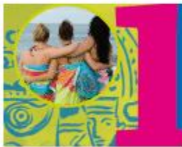
OVK-bk deel 1