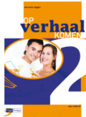
deel 2 vmbo-gt