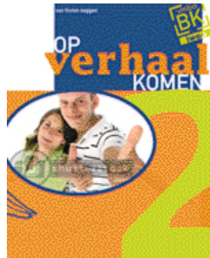
deel 2 vmbo-bk / lwoo