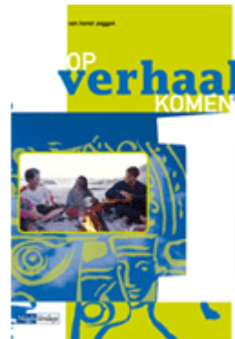
deel 1 vmbo-gt